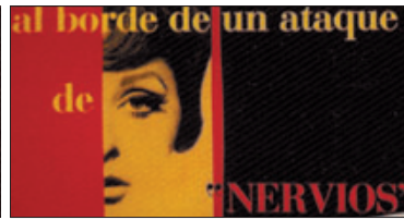
►► Letras con personalidad ► Algunos títulos de crédito de películas famosas de todas las épocas.